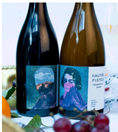
HAUTES PISTES PINOT NOIR / CHARDONNAY