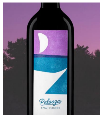
PALOOZA VIOGNIER / SYRAH VIOGNIER